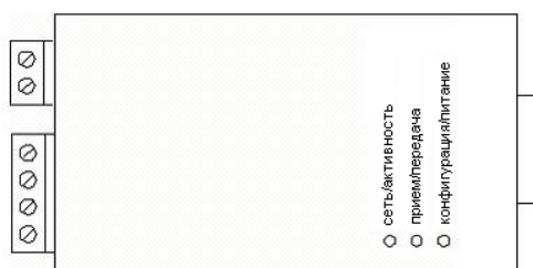
Рис 1. Расположение и назначение светодиодных индикаторов

Конфигурация/питание – питание и состояние конфигурации.